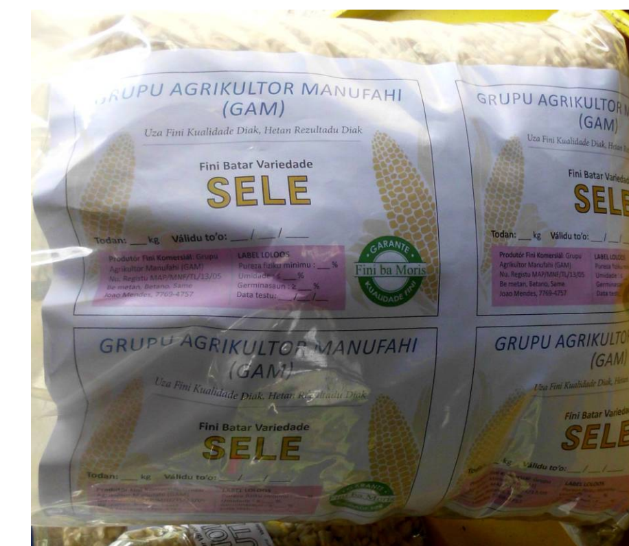
Pakote fini ba loja Agricultura