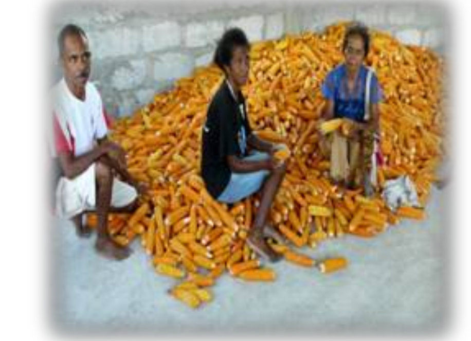
PFK RAIMEAN - BAUCAU