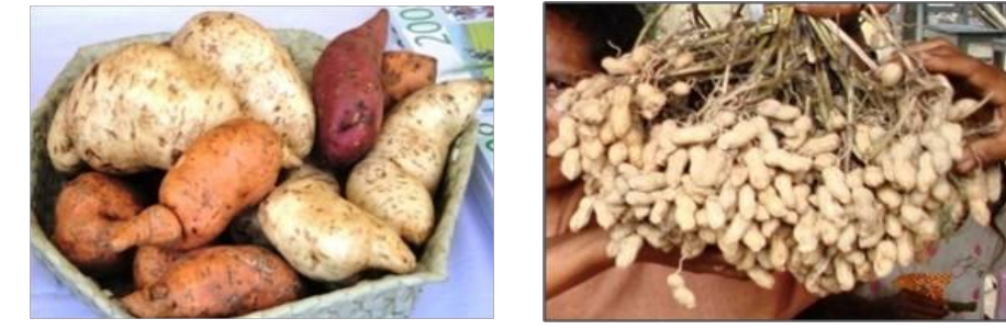
PFK LACABASE - BOBONARO